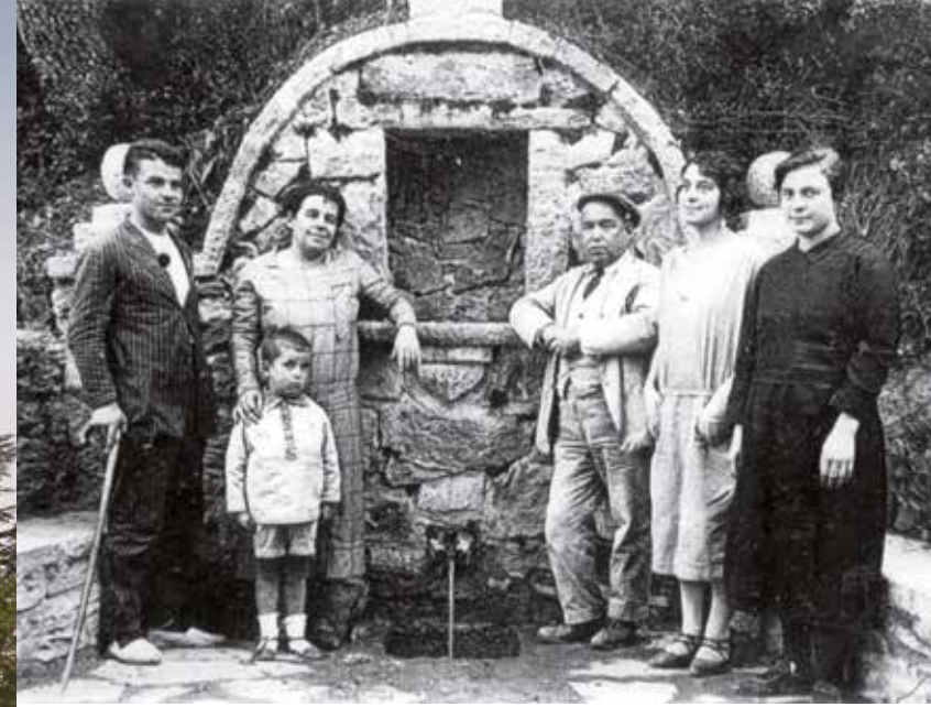
© Font de Planeses (c. 1925). Foto cedida al Archivo Histórico de Montesquiú por Nativitat Muñoz García