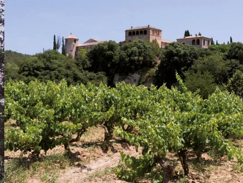
© Dani Codina / Jordi Folch