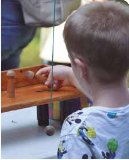
J. Melero / Diputació de Barcelona