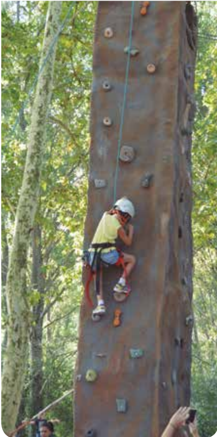
J. Melero / Diputació de Barcelona