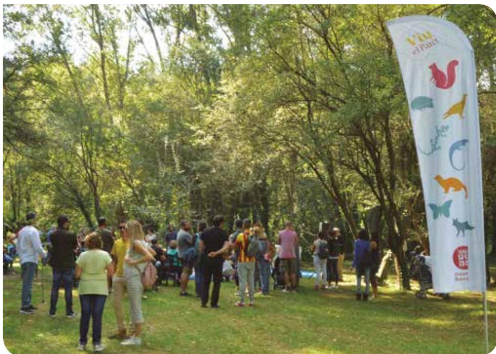
J. Melero / Diputació de Barcelona