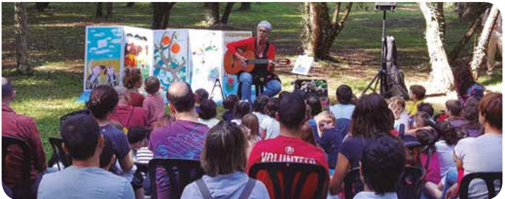
J. Melero / Diputació de Barcelona

El programa Viu el Parc us ofereix un munt d'activitats, variades i engrescadores, per apropar-vos als patrimonis natural i cultural de l'Espai Natural de les Guilleries-Savassona i dels municipis que el conformen. Veniu a gaudir-ne!