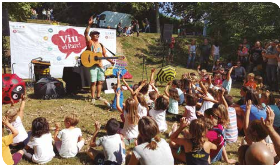
J. Mejero / Diputació de Barcelona

13 h Cloenda amb l'espectacle d'animació musical de Fefe i Cia .