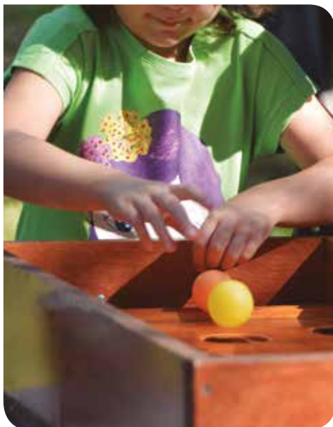
J. Meiero / Diputació de Barcelona

19 h Castanyada al Centre Cívic 20 h Cèltic Groove , música Celta al Centre Cívic