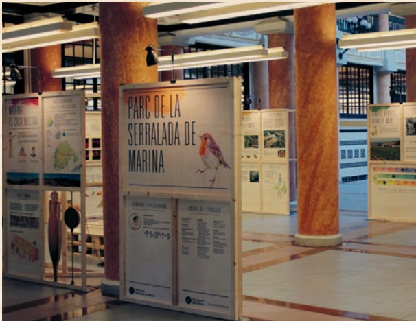
Exposició Parc de la Serralada de Marina

Parc de la Serralada de Marina és una exposició en què la Marina, una jove laietana que va viure en el poblat ibèric de les Maleses, ens descriu els diversos aspectes del Parc, des del paisatge, la vegetació i la fauna, fins als objectius que cal tenir en compte per protegir-lo i garantir-ne un ús públic respectuós.