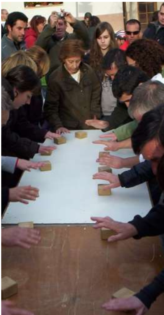
Esclops d'en Pau