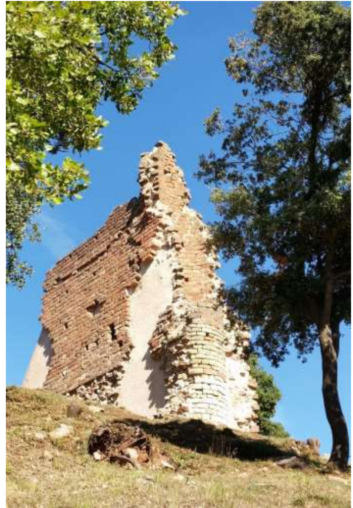
Llegendes: el castell del Brull