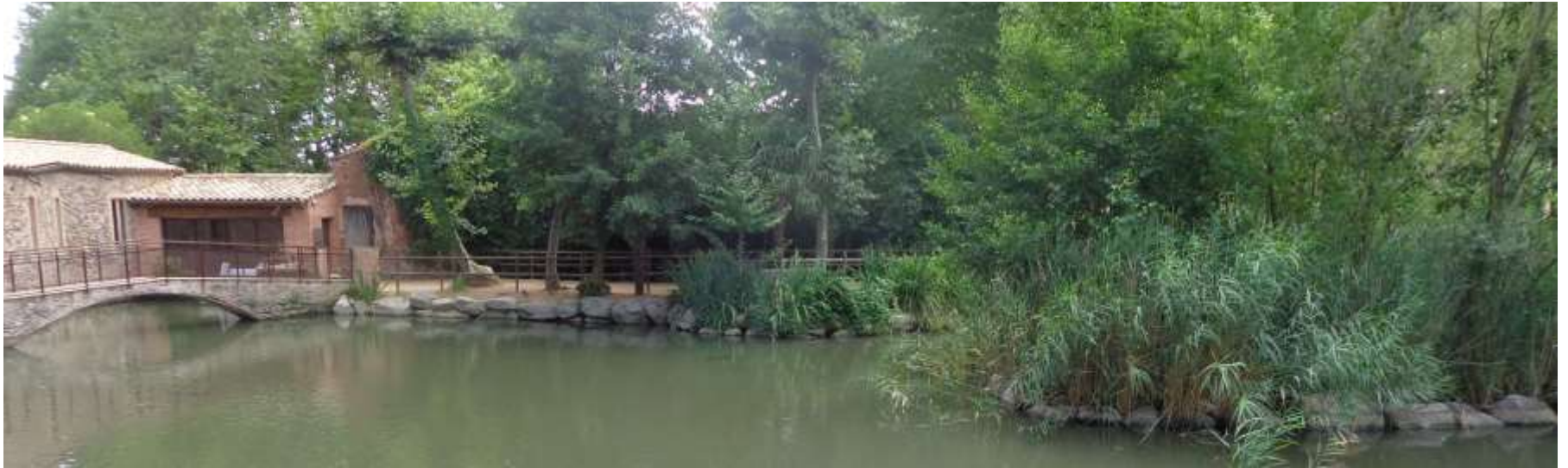
Aprofitament de l'aigua