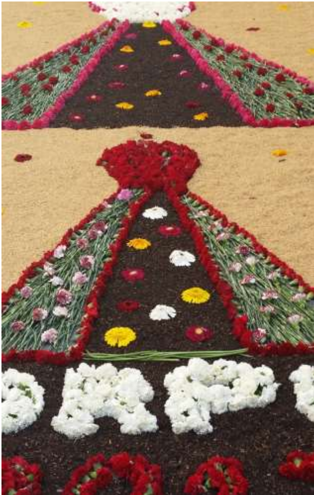
Festes de Corpus