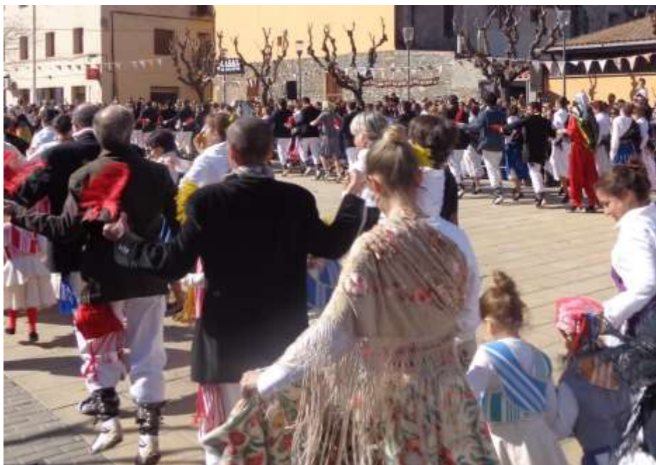
Ball de gitanes

Els usos, les representacions, les expressions, els coneixements i les tècniques [...] que les comunitats, els grups i en alguns casos els individus reconequin com a part integrant del seu patrimoni cultural.