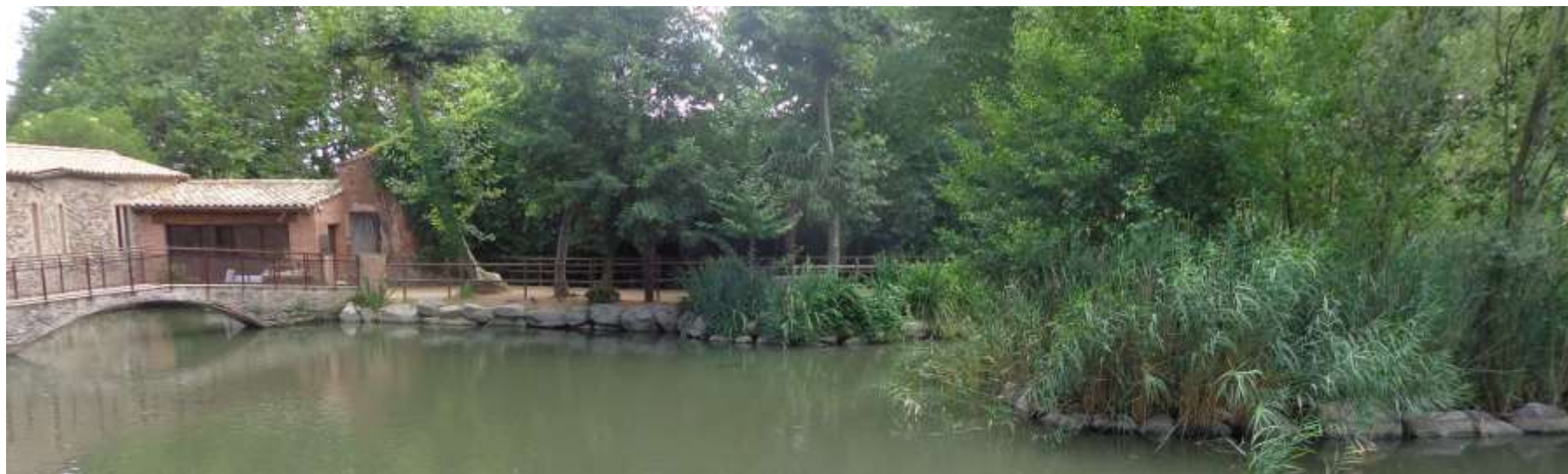
Aprofitament de l'aigua