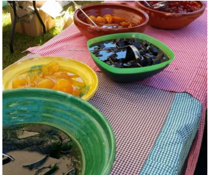
Fira-mercat de Sant Ponç