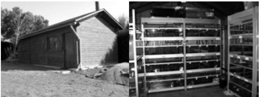
Figura 3. Instal·lacions del centre de cria al CF de Torreferrussa

Actualment, ja es disposa d'un document tècnic on es marquen les directrius que cal seguir en el programa de cria en captivitat. S'hi defineixen dos objectius ben diferenciats: la creació d'una reserva genètica i l'obtenció d'exemplars per a reforçaments poblacionals.