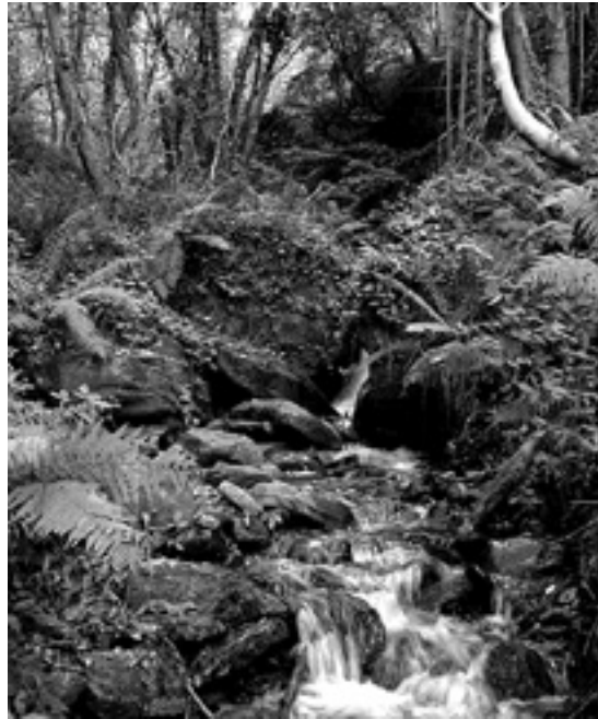
Figura 2. Hàbitat del tritó del Montseny

És exclusiu dels medis reòfils de petit cabal i dimensions: torrents amb molt pendent, encaixats entre parets laterals d'alçada inferior a 50 m amb una estructura formada per basses, descarregadors i cascades. Aquests torrents presenten un cabal subterrani amb augment superficial durant la primavera i tardor, i una sequera estival i sovint hivernal. Necessita substrats d'esquist amb moltes fissures, per on accedeix a les aigües subterrànies, imprescindibles per superar els períodes de sequera estival, que en alguns casos deixen el torrent sense aigües superficials durant l'estiu (figura 2). Els exemplars juvenils no presenten la fase terrestre que presenta el tritó del Pirineu, i per això les úniques vies de dispersió són