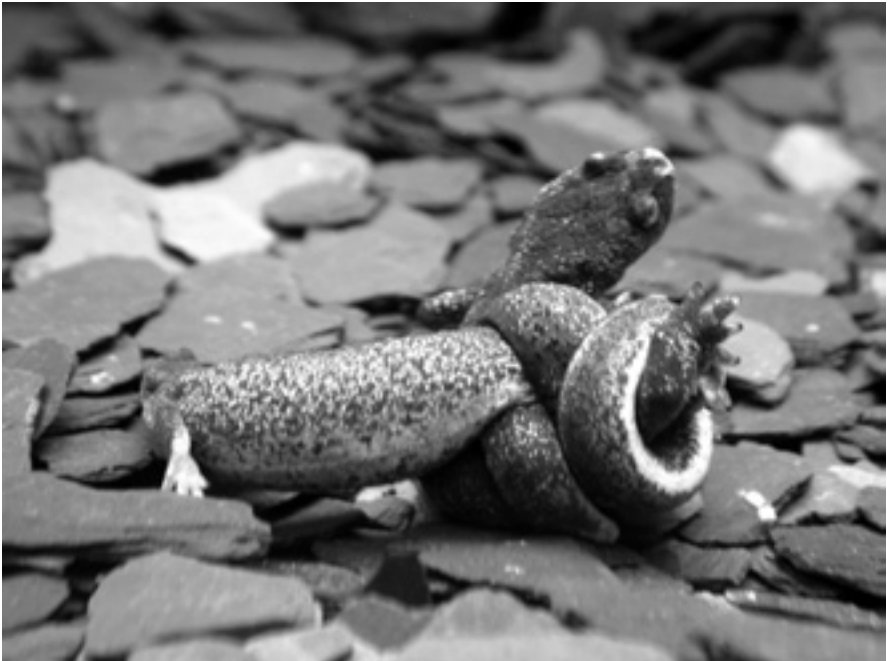
Figura 4. Amplexu entre dos exemplars

S'han vist còpules durant tot l'any, amb un màxim a partir de febrer i fins a l'estiu. El mascle es manté amb la cua enlairada fins que s'apropa la femella, llavors l'envolta i intenta ajuntar les dues cloaques per passar-li l'espermatòfor (figura 4). S'ha observat que la femella és capaç de pondre ous fèrtils després de gairebé un any des de l'últim contacte amb un mascle.