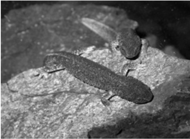
Figura 6. Juvenils de tritó del Montseny

l'espècie fan molt difícil fer-ne el seguiment. Es van marcar amb elastòmers tots els exemplars alliberats i les prospeccions al cap d'un any han demostrat una supervivència força elevada. Caldrà veure si aquests exemplars són capaços de reproduir-se en llibertat i formar poblacions viables per si mateixes.