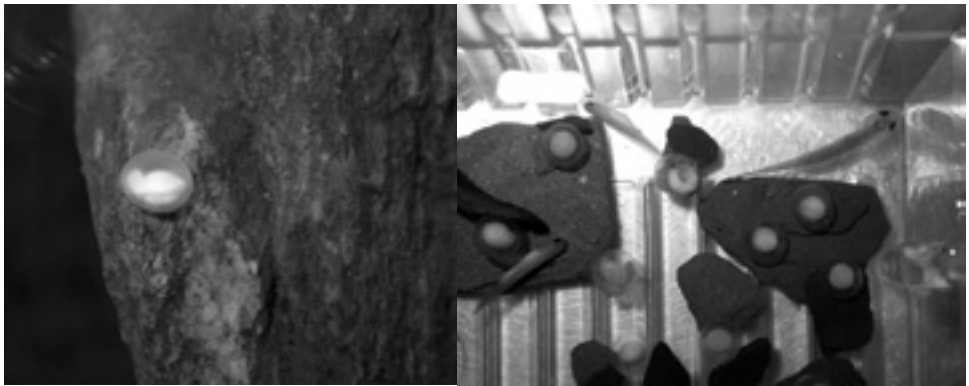
Figura 5. Ous i larves de pocs dies

Quan neixen, les larves fan poc més d'un centímetre i presenten un gran sac vitel·lí que els serveix d'aliment les primeres setmanes. En aquests primers mesos de vida és quan es produeix més mortalitat: durant els primers anys del projecte s'aproximava al 50%, però en els últims anys s'ha aconseguit reduir-la a tan sols un 20%. En néixer presenten esbossos de les extremitats anteriors i una coloració blanca amb certa pigmentació dorsal. Durant el període de creixement es van desenvolupant les extremitats i van agafant la coloració fosca. Al cap d'un any aproximadament les larves fan la metamorfosi (en alguns casos s'ha observat al cap de 6 mesos i en altres han tardat fins a 2 anys).