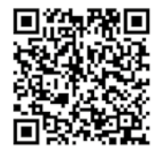
Parc a taula

Parc a taula est un programme de développement économique promu par le Conseil provincial de Barcelone qui s'adresse aux agents privés qui, par le biais de leur activité, contribuent à la conservation, la mise en valeur et la divulgation des espaces naturels protégés. Vous trouverez de plus amples renseignements que vous pourrez télécharger sur parcs.diba.cat/web/parc-a-taula et dans l'application :