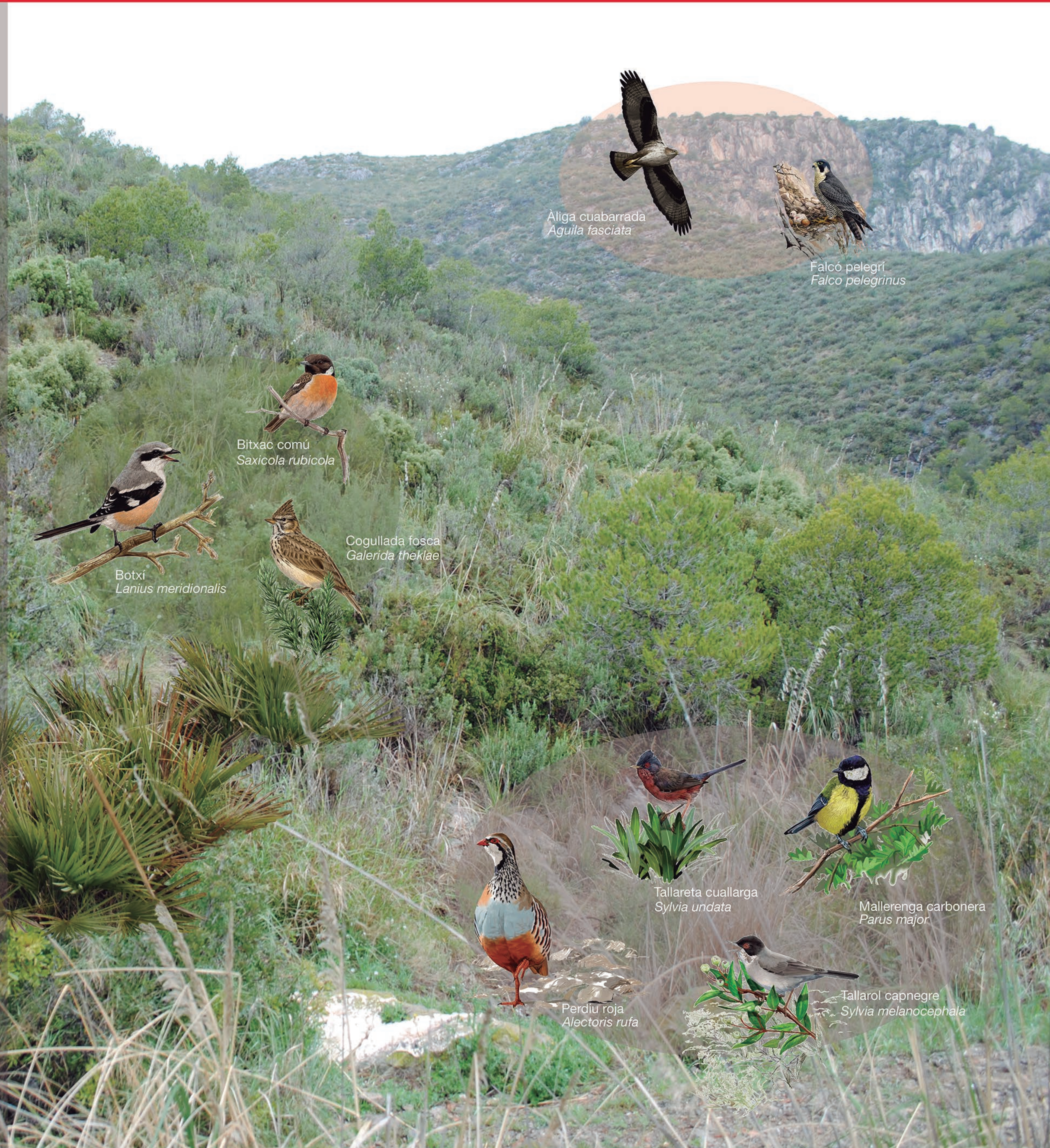
Àliga cuabarrada Aquila fasciata

Il·lustracions: Martí Franch i Toni Llobet