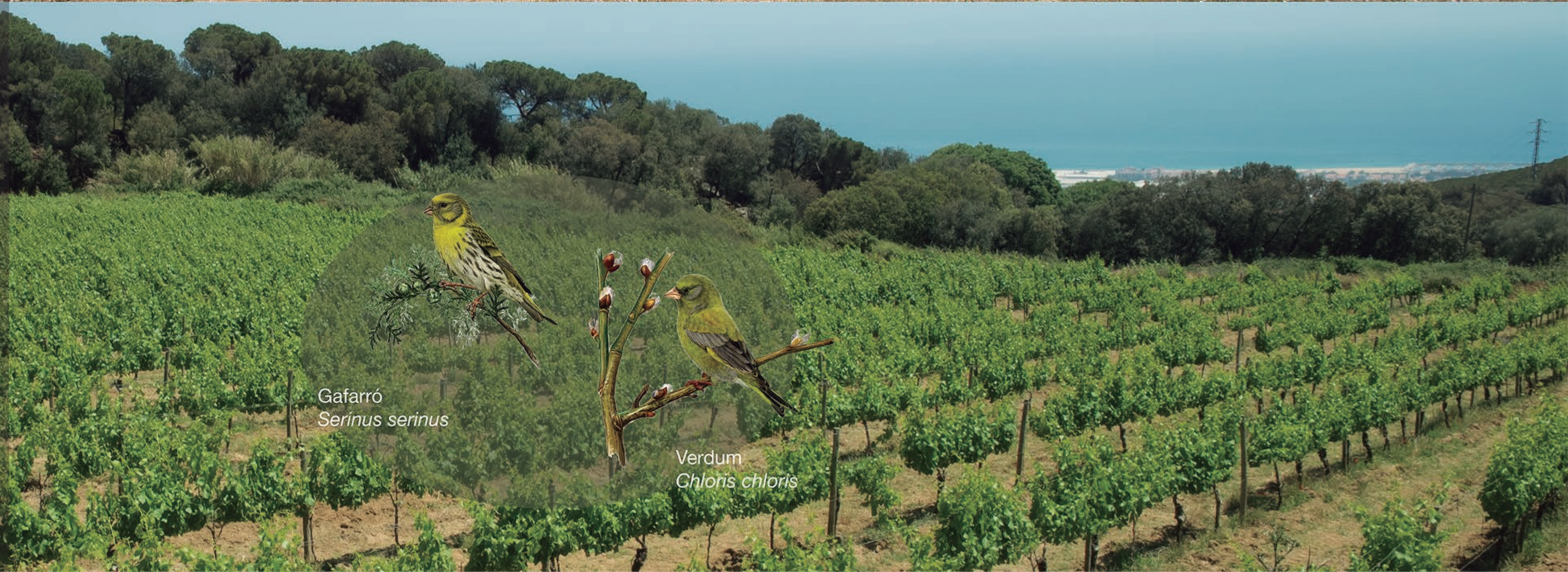
Gafarró Serinus serinus