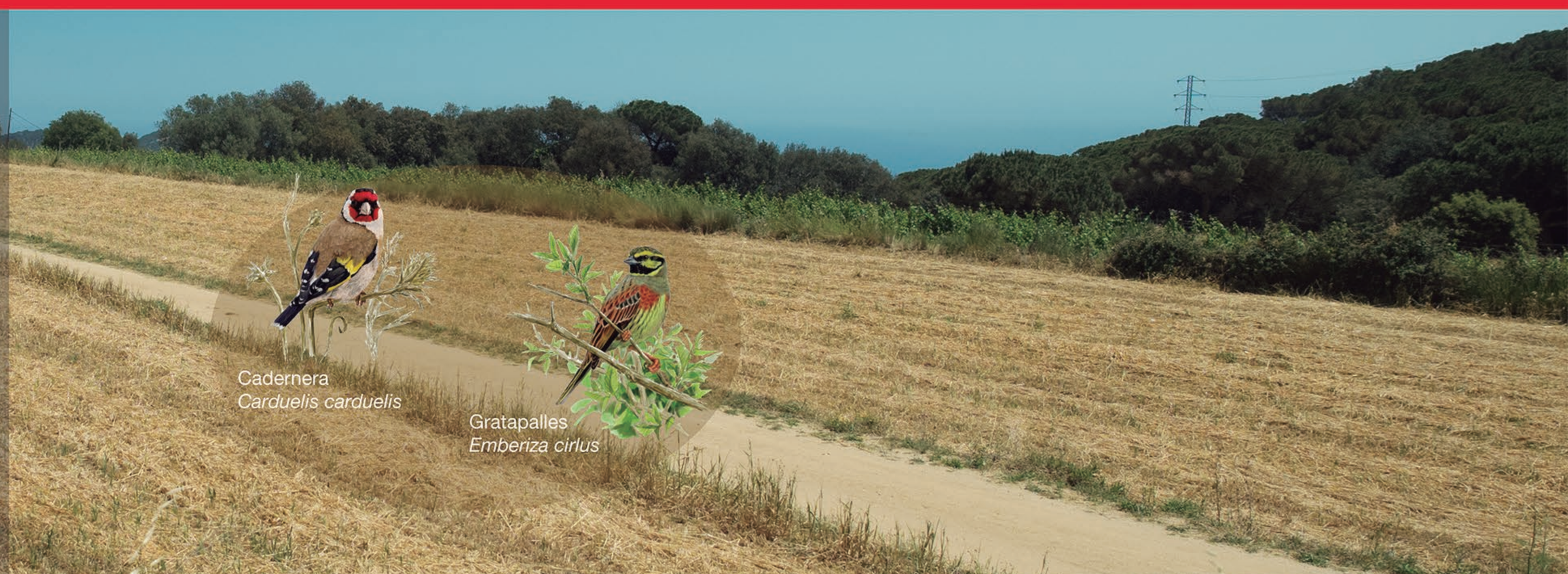
Cadenera Carduelis carduelis

Els indicadors del SOCC mostren que al nord de la Serralada Litoral hi ha menys ocells d'espais oberts. Per tant, la gestió d'aquests espais serà determinant per a aquestes espècies.