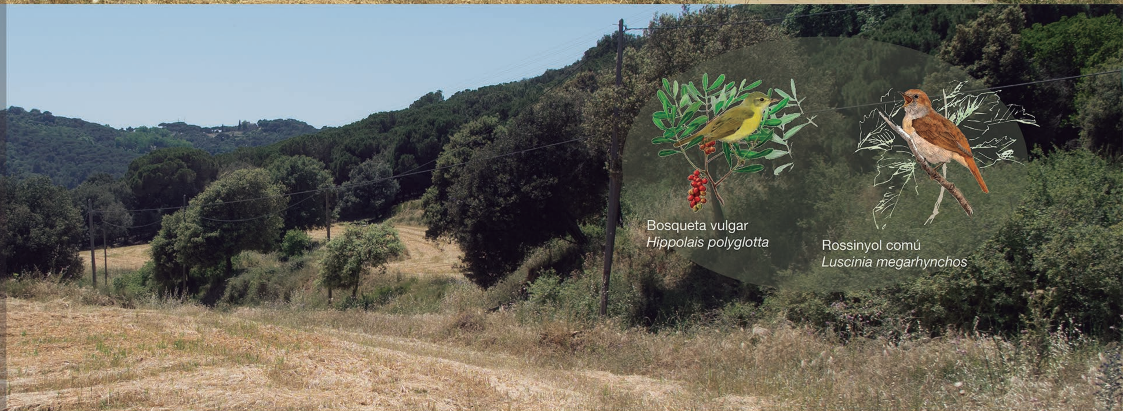
Bosqueta vulgar Hippolais polyglotta